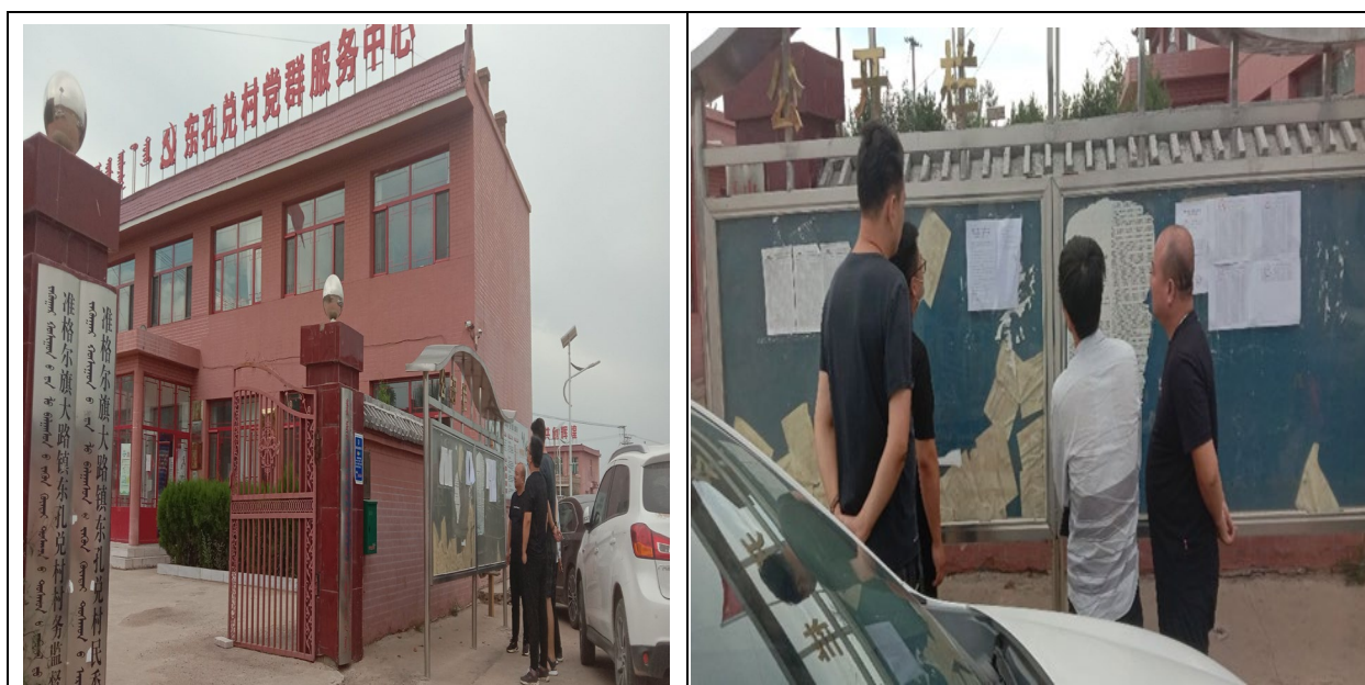
图 5 准格尔旗大路镇东孔兑沟村张贴公告情况