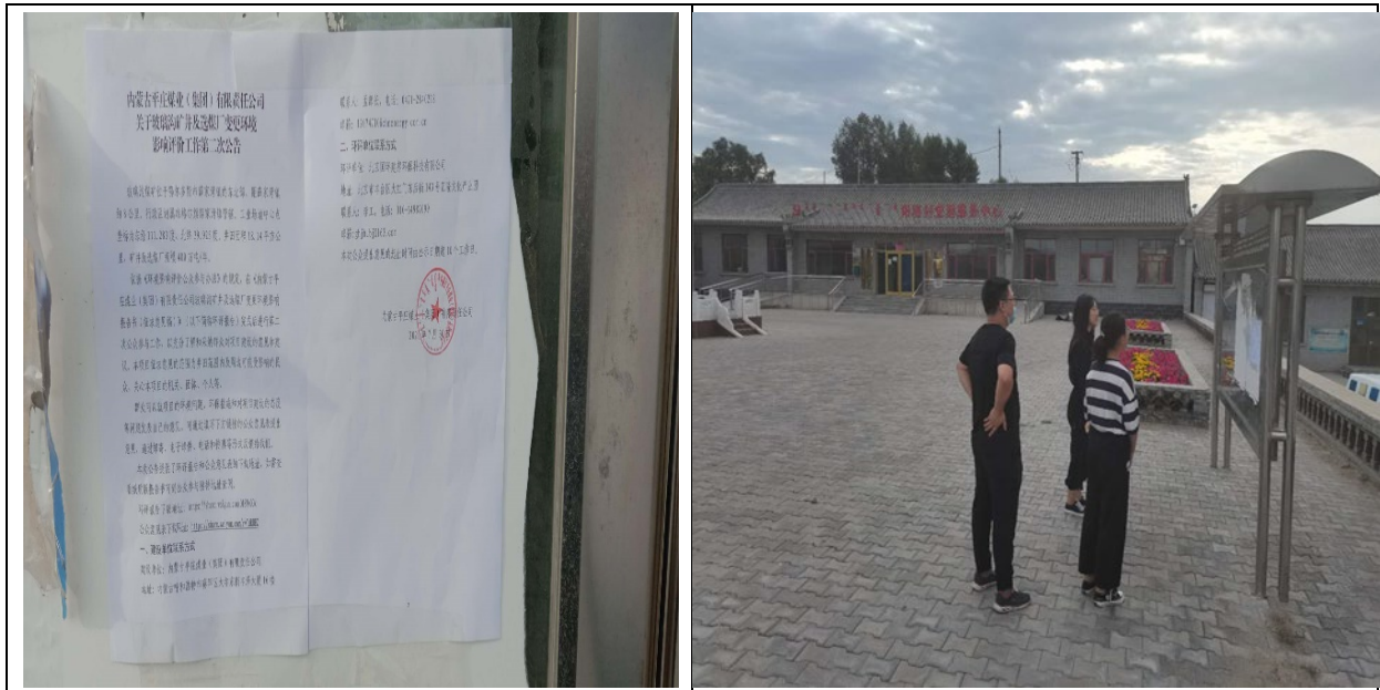
图 8 准格尔旗薛家湾镇阳塔村张贴公告情况