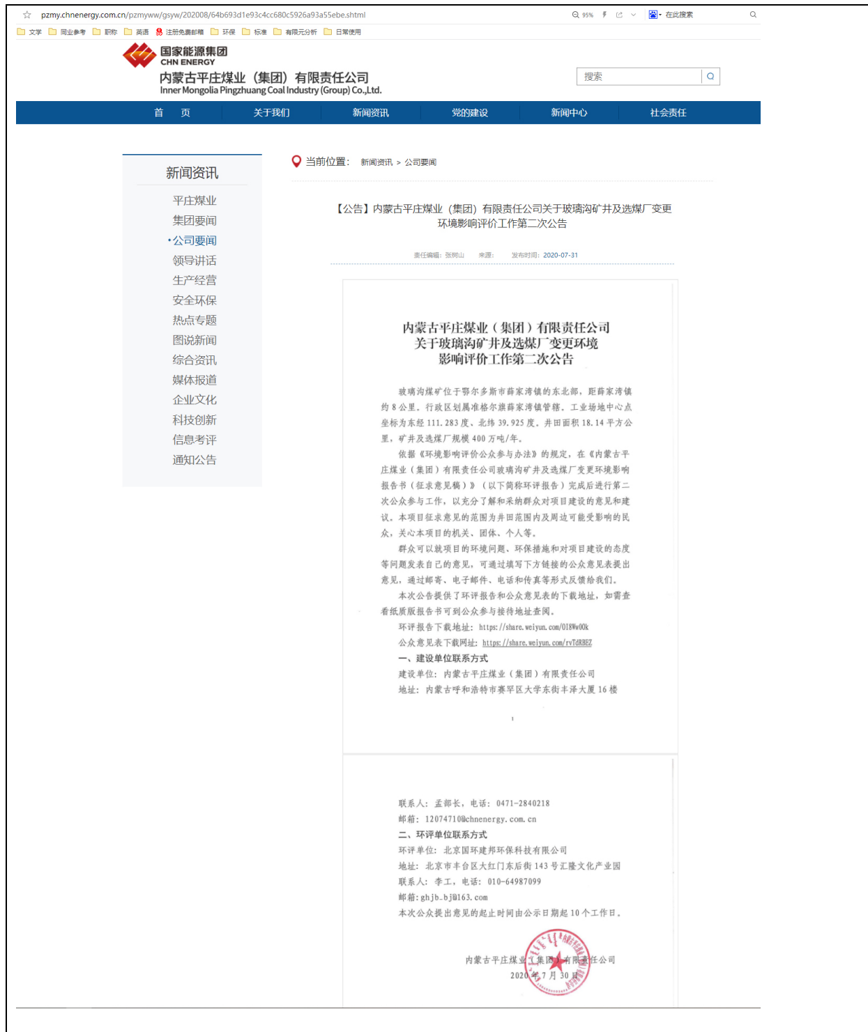
图 2 项目网站公告情况