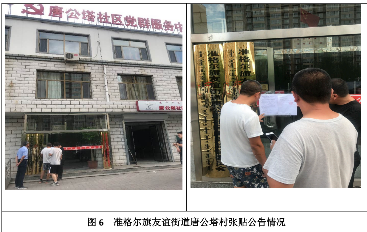
图 6 准格尔旗友谊街道唐公塔村张贴公告情况