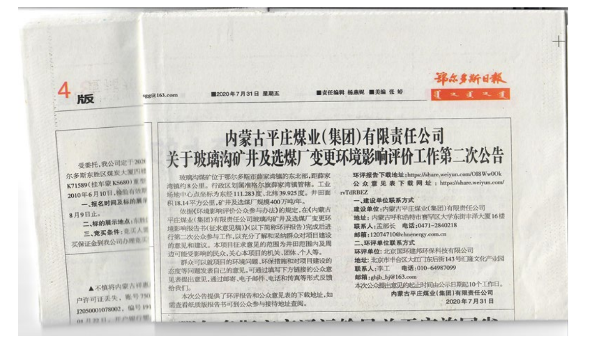
图3 2020年7月31日 鄂尔多斯日报