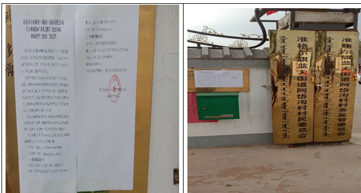
图 7 准格尔旗蓝天街道阿岱沟村张贴公告情况